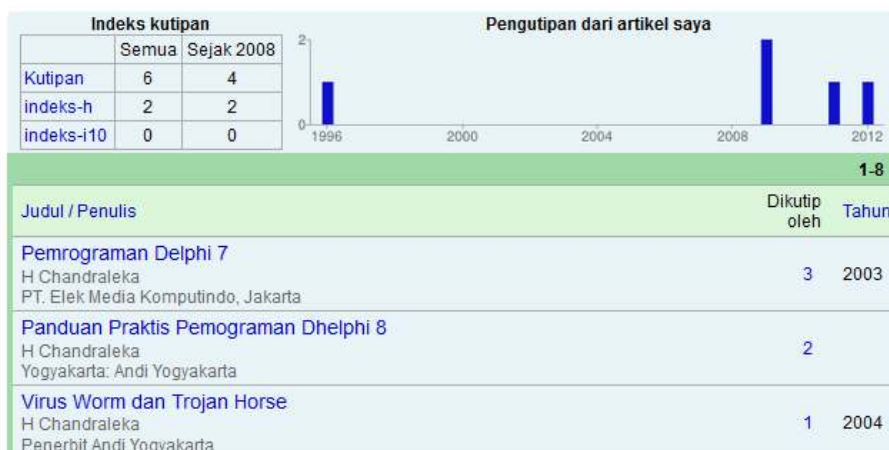
Profil penulis di Google Scholar