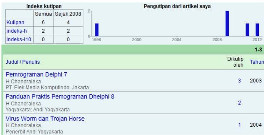
Profil penulis di Google Scholar

Independent IT Writer computer - writing Email yang diverifikasi di litbang.depkes.go.id Beranda