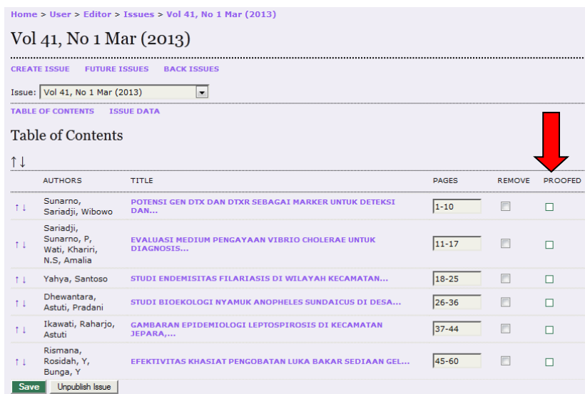
Gambar 2. Tidak terdapat tanda centang pada bagian PROOFED di artikel

Pada artikel yang diproses dengan Quick Submit, tidak terdapat tanda centang pada bagian PROOFED pada artikel yang bersangkutan.