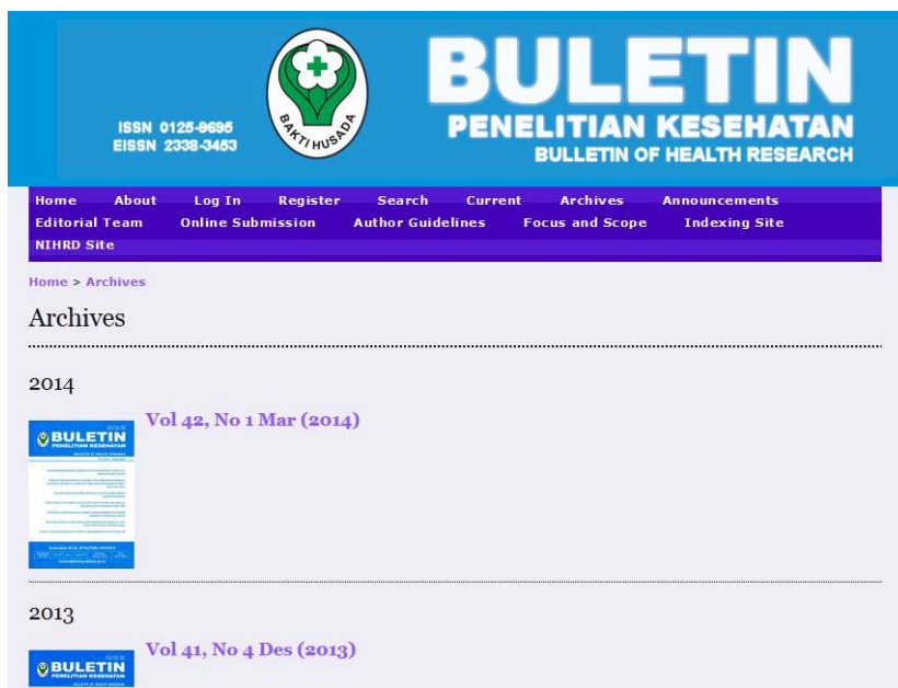
Gambar 1. Edisi jurnal yang tampil pada bagian Archive