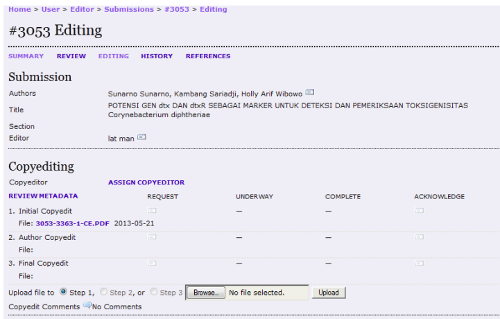
Gambar 3. Catatan Copyediting masih kosong