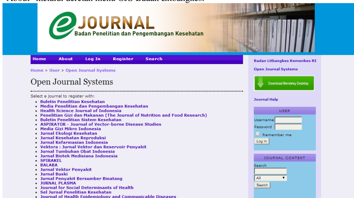
Gambar 2. Laman List Jurnal yang Dimiliki Badan Litbangkes

PENTING!: Untuk detail focus & scope dari masing-masing jurnal, kita bisa mengakses menu “About” melalui deretan menu OJS Badan Litbangkes.