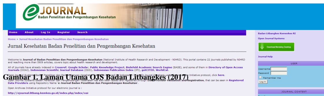
Gambar 1. Laman Utama OJS Badan Litbangkes (2017)

Langkah 1: Buka browser kemudian akses alamat OJS Badan Litbangkes di http://ejournal.litbang.kemkes.go.id . Agar tidak lupa, bookmark URL Badan Litbangkes sehingga kita cukup mengakses melalui bookmark yang sudah kita buat.